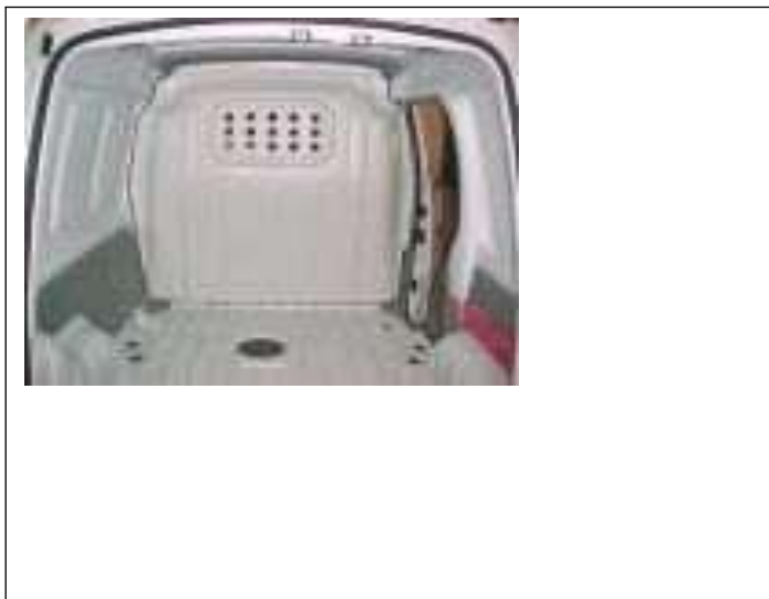
Figura 2 (veículos utilitários)